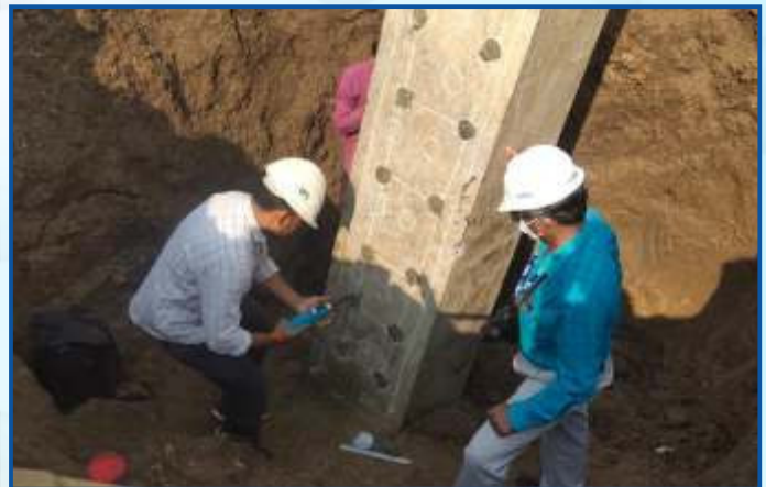
Environmental Testing Bhopal Metro Site