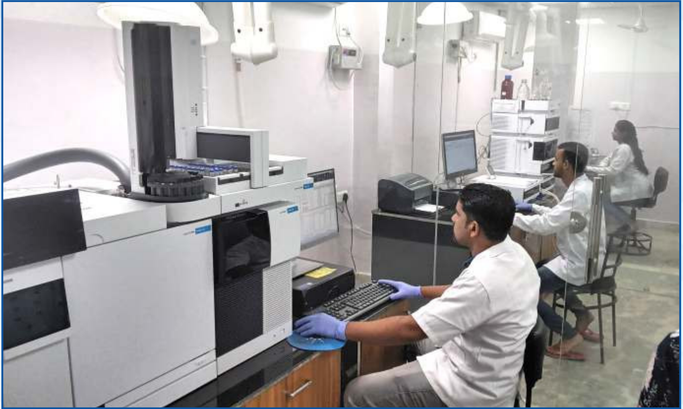
GCMSMS and HPLC