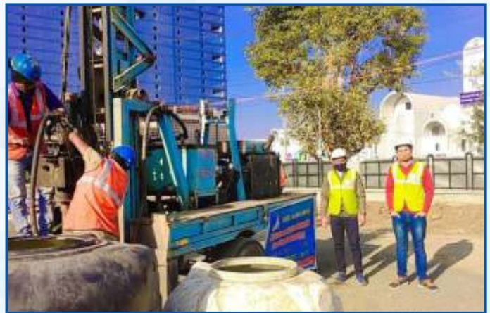
Environmental Testing & Soil Investigation at Bhopal Metro Site